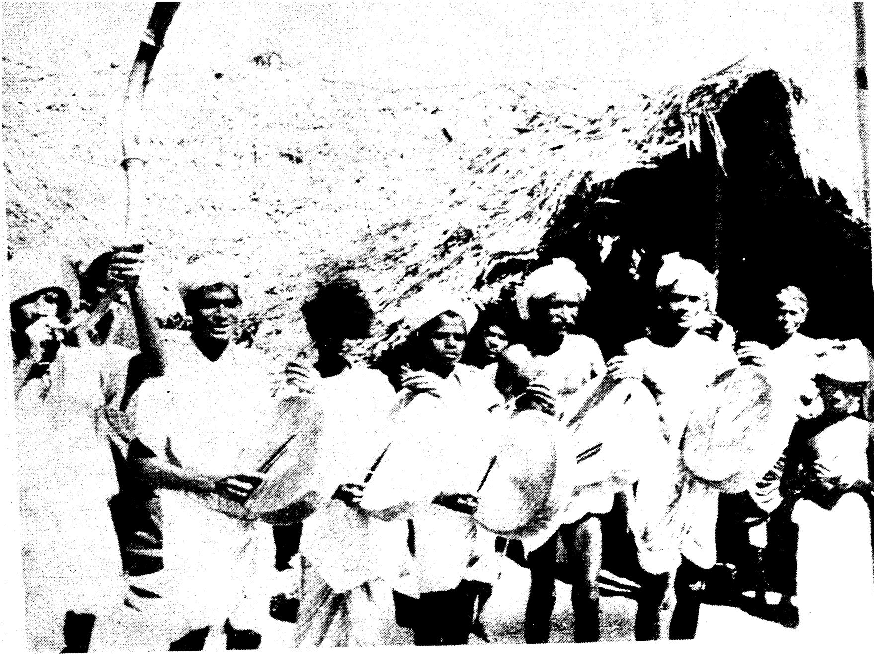
लोक वाद्य तप्पट्टै